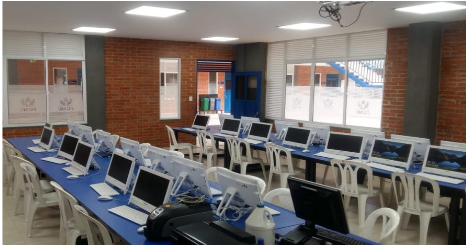
Ilustración 2. Sala de Computo