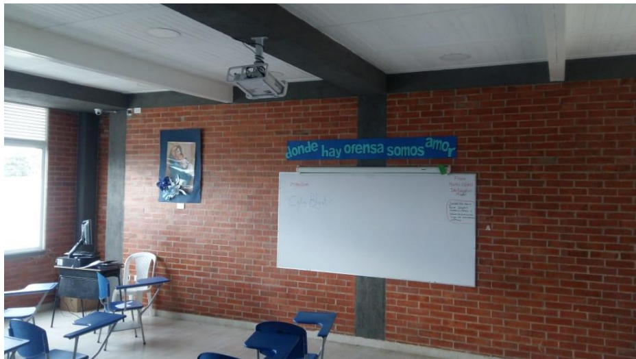
Ilustración 1. Aula de Clase