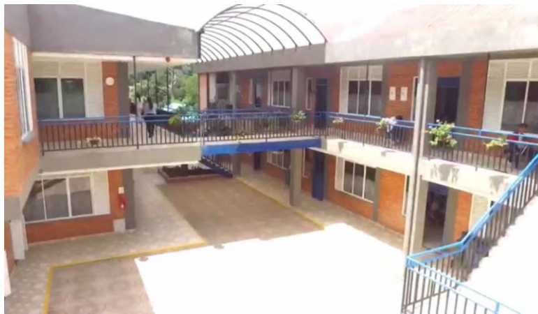
Ilustración 6. Vista Aérea Planta Física F.G.M.C