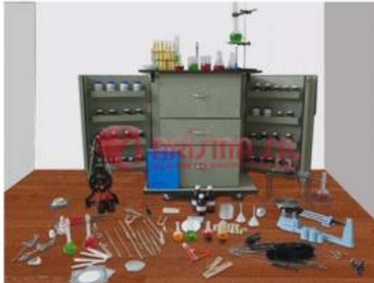
Ilustración 4. Foto de Laboratorio Modular de Química

Con lo cual anterior, se brindan las condiciones requeridas para que las clases sean altamente satisfactorias para nuestra comunidad estudiantil generando ambientes académicos favorables en pro de nuestro objetivo visional: “Seremos en 2.021 una organización reconocida en la prestación de servicios educativos de alta calidad, mediante la implementación de los sistemas integrados de gestión, enfocados a la satisfacción de la familia Gimnasta, que nos permitirá convertirnos en un referente nacional.”