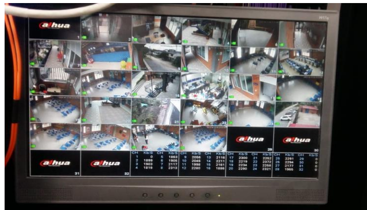
Ilustración 3. Circuito Cerrado de Televisión