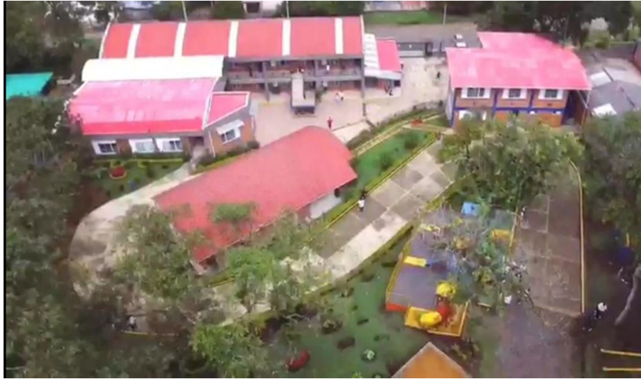
Ilustración 5. Vista Aérea Planta Física F.G.M.C

La Fundación Gimnasio Moderno del Cauca cuenta con una amplia sede campestre, construida en un área aproximada de 12.000 m 2 , distribuidas en un edificio de aulas (12 Aulas), edificio administrativo y tecnológico (primer piso sala de cómputo y baterías sanitarias, segundo piso oficinas administrativas), edificio Auxiliar (sala de profesores, un aula de clase y un aula múltiple), zona recreativa (juegos infantiles y polideportivo de cancha múltiple), brindando espacios confortables para el desarrollo de actividades lúdico-académicas: